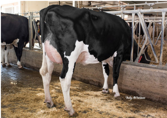
PROGENESIS OUTL WINTERBERRY THIRD DAM